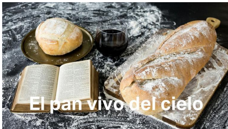
El pan vivo del cielo

* TU AYUDA MARCANDO LA CASILLA DE LA IGLESIA EN LA DECLARACIÓN DE LA RENTA. En plena campaña de presentación de la declaración de la Renta, MANIFIESTA TU AYUDA A LA IGLESIA MARCANDO LA CASILLA EN FAVOR DE LA MISMA.